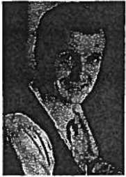
Bundesminister Martin Bartenstein

Ein modernes Berufsbildungssystem zeichnet sich durch die Verbindung einer praxisorientierten Ausbildung mit der Vermittlung von fundiertem fachtheoretischem Wissen und maßgeblichen Schlüsselkompetenzen aus. Die Lehre erfüllt genau diese Anforderungen. Sie verbindet die Vorteile der beiden Lernorte Betrieb und Schule ideal miteinander: Die praktische Ausbildung erfolgt im Betrieb, dort wo sie am besten vermittelt werden kann; die ergänzende fachtheoretische Ausbildung findet in der Berufsschule statt.